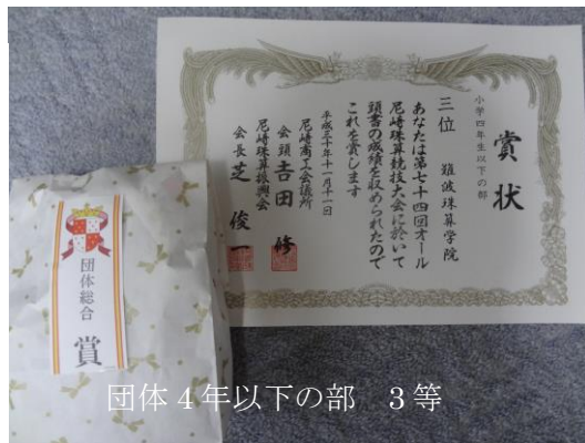
団体4年以下の部 3等

競技会の種目は 総合競技 6 種目（算盤と暗算で かけ算 わり算 30問 みとり算 15問ずつ）900点満点で獲得点数を競い 種目別競技は 読み上げ算（暗算とそろばん）15問 120点満点での獲得点数を競います。総合競技は 個人と団体（上位3名の合計点数）で優勝（1人）準優勝（1人）・2等、3等（参加人数で調整）がきまり、読み上げ算は個人で優勝（1人）と2等（2人）3等（3人）がきまります。