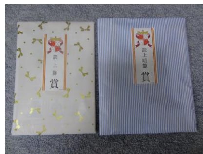
読み上げ算 読み上げ暗算の個人で優勝の次の2等をいただいた人もいました

競技会の種目は 総合競技 6 種目（算盤と暗算で かけ算 わり算 30問 みとり算 15問ずつ）900点満点で獲得点数を競い 種目別競技は 読み上げ算（暗算とそろばん）15問 120点満点での獲得点数を競います。総合競技は 個人と団体（上位3名の合計点数）で優勝（1人）準優勝（1人）・2等、3等（参加人数で調整）がきまり、読み上げ算は個人で優勝（1人）と2等（2人）3等（3人）がきまります。