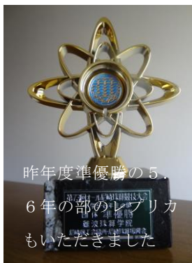
昨年度準優勝の5, 6年の部のレプリカもいただきました

2018年11月11日（日曜日）に尼崎商工会議所で 尼崎珠算振興会・尼崎商工会議所主催のそろばん競技会がありました。市内の算盤教室に通う小学生 中学生 高校生 社会人が集まり 日頃の算盤・暗算の練習の成果を競いあいました。本学院からも小学4年以下の部で 3年生1名 4年生2名 小学5.6年の部で5年生3名 6年生3名が参加してくれました。みんなよく頑張ってくれたので 団体では 小学校3, 4年の部で3等 5, 6年の部で2等をいただいたほか 個人で種目別や総合で2等3等をいただくことができ 参加した子供たちの励みになりました。